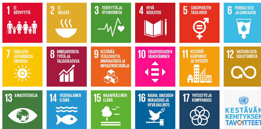
Kuva 2 Kestävän kehityksen tavoitteet Agenda 2030 -toimintaohjelmassa

Pohjanmaan maakuntastrategian lähtökohtana on luoda perusta ekologisesti, sosiaalisesti, kulttuurisesti ja taloudellisesti kestäväälle Pohjanmaalle. Pohjanmaan kehittämisen pitkän aikavälin tavoitteiden taustalla on kestävän kehityksen Agenda 2030 -toimintaohjelma, joka sisältää 17 tavoitetta (kuva 2).