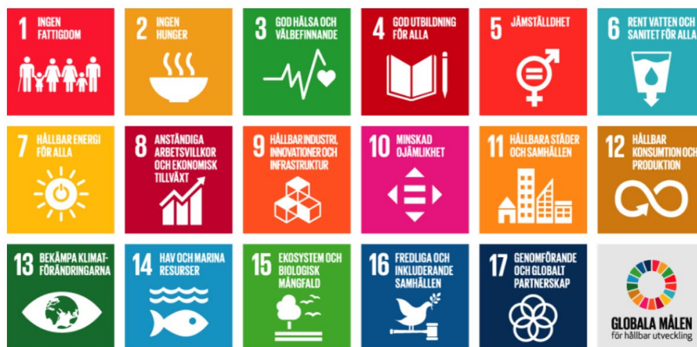
Bild 2 Målen för hållbar utveckling i handlingsprogrammet Agenda 2030

Utgångspunkten för Österbottens landskapsstrategi är att skapa grund för ett ekologiskt, socialt, kulturellt och ekonomiskt hållbart Österbotten. Bakgrunden till de långsiktiga utvecklingsmålen för Österbotten utgörs av handlingsprogrammet Agenda 2030, som innefattar 17 mål (bild 2).